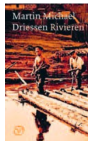
Rivieren MARTIN MICHAEL DRIESSEN. UITG. VAN OORSCHOT, AMSTERDAM 2016. 130 BLZ. € 17,08