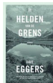
Helden van de grens DAVE EGGERS. UITG. LEBOWSKI, AMSTERDAM 2016. 365 BLZ. € 22,50.